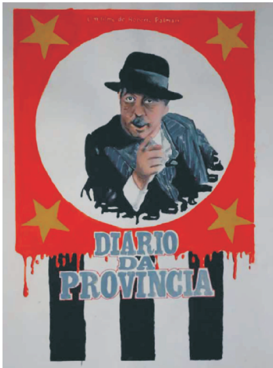
Cartaz do longa-metragem O Diário da Província (1978) dirigido por Roberto Palmari. Reprodução em guache e giz pastel de Amanda Marcolino.